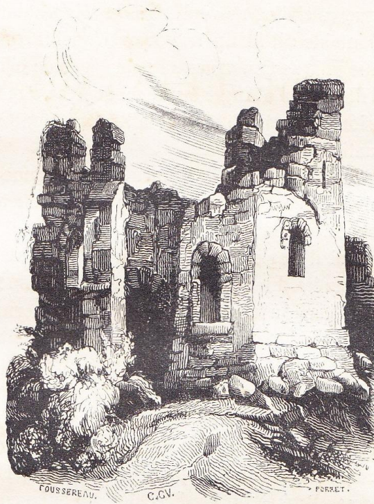
Architecture militaire du XIII e siècle; ruines du château de Wigmore, construit sous le règne d'Etienne.

Wigmore, une foule d'autres forteresses, et notamment toutes celles de Henri, évêque de Winchester, furent détruites.